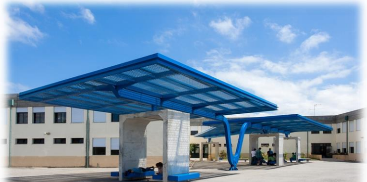
Fig. 3 – Escola Básica Deu-la-Deu Martins

Esta escola, em funcionamento desde 1989, possui espaços comuns ( cf. fig. 3 ) que são constituídos pela sala de professores, bufete, reprografia, secretaria, cozinha/cantina, papelaria, espaço exterior polidesportivo e pavilhão gimnodesportivo (pavilhão municipal). Existem ainda três gabinetes para uso da coordenação do estabelecimento, GICD/Código de conduta e um para os SPO.