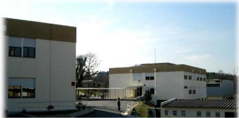
Fig. 2 – Escola Secundária

No total, ocupa um espaço de implantação de 4339m 2 e 6664m 2 de área bruta de construção, num lote com área de 20,670m 2 , considerado como recinto escolar. Os pavilhões 1 e 2, ambos