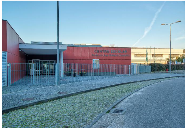
Fig. 7 – Escola Básica José Pinheiro Gonçalves

Uma parte do edifício tem 2 pisos, é composto por 18 salas de aula, uma sala de TIC e uma sala de psicomotricidade e 6 salas de expressões. Duas adaptadas para salas de apoio educativo e projeto TurmaMais e duas adaptadas para o funcionamento da VAE. Possui também 1 secretaria, 1 gabinete para a coordenação