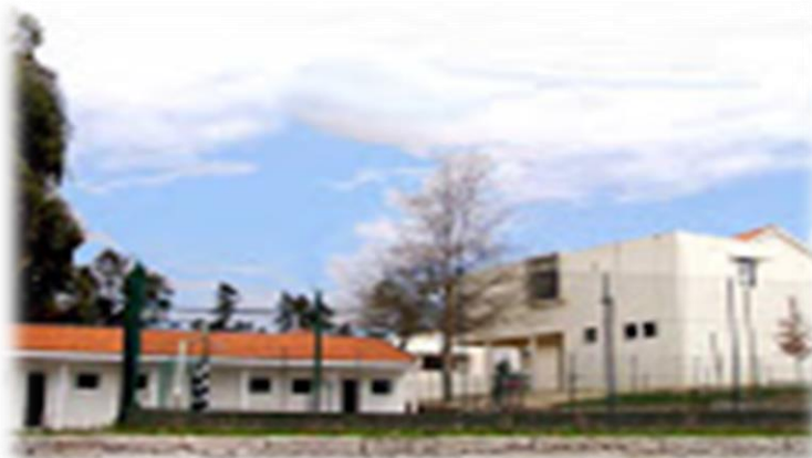
Fig. 5 – Escola Básica de Estrada, Monção

Esta escola está localizada na União das Freguesias de Mazedo e Cortes e recebe crianças/alunos do pré-escolar e do 1.º ciclo. É composta por 2 edifícios. O edifício principal ( cf. fig. 5 ) possui 5 salas de aula, mais um espaço anexo a uma destas salas onde funcionam os apoios educativos, terapias e uma pequena sala de professores.