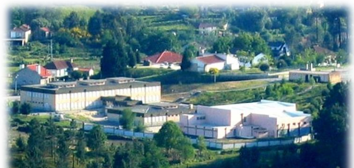
Fig. 4 – Escola Básica Vale do Mouro

Este estabelecimento entrou em funcionamento no ano de 1994, sob a dominação de Escola Preparatória de Tangil - Monção, situa-se na parte este do concelho de Monção e dá respostas educativas às crianças/alunos do 1.º, 2.º e 3.º ciclos da área geográfica do Vale do Mouro. É um edifício T18, monobloco ( cf. fig. 4 ), distribuído