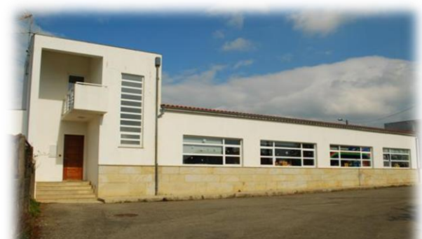
Fig. 8 – JI de Cortes

Este estabelecimento de educação é constituído por 2 edifícios ( cf. fig. 8 ), um do tipo plano centenário com 2 salas de atividades, destinando-se uma delas à receção das crianças, apoio às terapias e às atividades de animação e apoio à família (AAAF) e 1 coberto fechado.