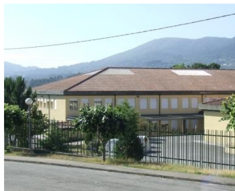
Fig. 6 – Escola Básica de Pias

Esta escola está localizada na Freguesia de Pias e recebe as crianças/alunos do pré-escolar e do 1.º e 2º ciclos. É um edifício de 2 pisos onde funcionam 3 com educação pré-escolar, 7 salas de aulas do 1.º CEB, todas com quadros interativos, mais 1 sala onde funciona a TurmaMais, e outra sala para apoios educativos. Ao nível do 2º ciclo existem salas específicas para as disciplinas de EVT/ET, CN, EM e TIC. Possui outras salas específicas onde funcionam as terapias do Centro de Recursos para a Inclusão (CRI), a valência de apoio especializada (VAE), a biblioteca escolar (integrada na rede de bibliotecas), a sala de funcionamento da AAAF e ainda um pequeno espaço polivalente. A escola dispõe de 1 sala de professores, cantina/refeitório, bufete e papelaria/reprografia. Existe também um campo de jogos exterior e um pavilhão gimnodesportivo com utilização comunitária fora do horário letivo. O espaço exterior é amplo, vedado, com parque infantil e ajardinado.